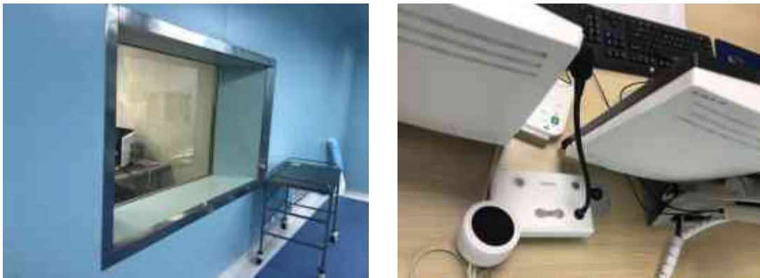
图3-4 观察窗和对讲系统

医院在DSA室与其控制室内设置双向语音对讲装置，且DSA室控制台处安装有观察窗，在诊断过程中医务人员可以及时观察患者情况和与患者交流，保证诊断质量和防止意外情况的发生。经现场核查，该对讲系统运行正常。DSA室观察窗和对讲系统见图3-4。