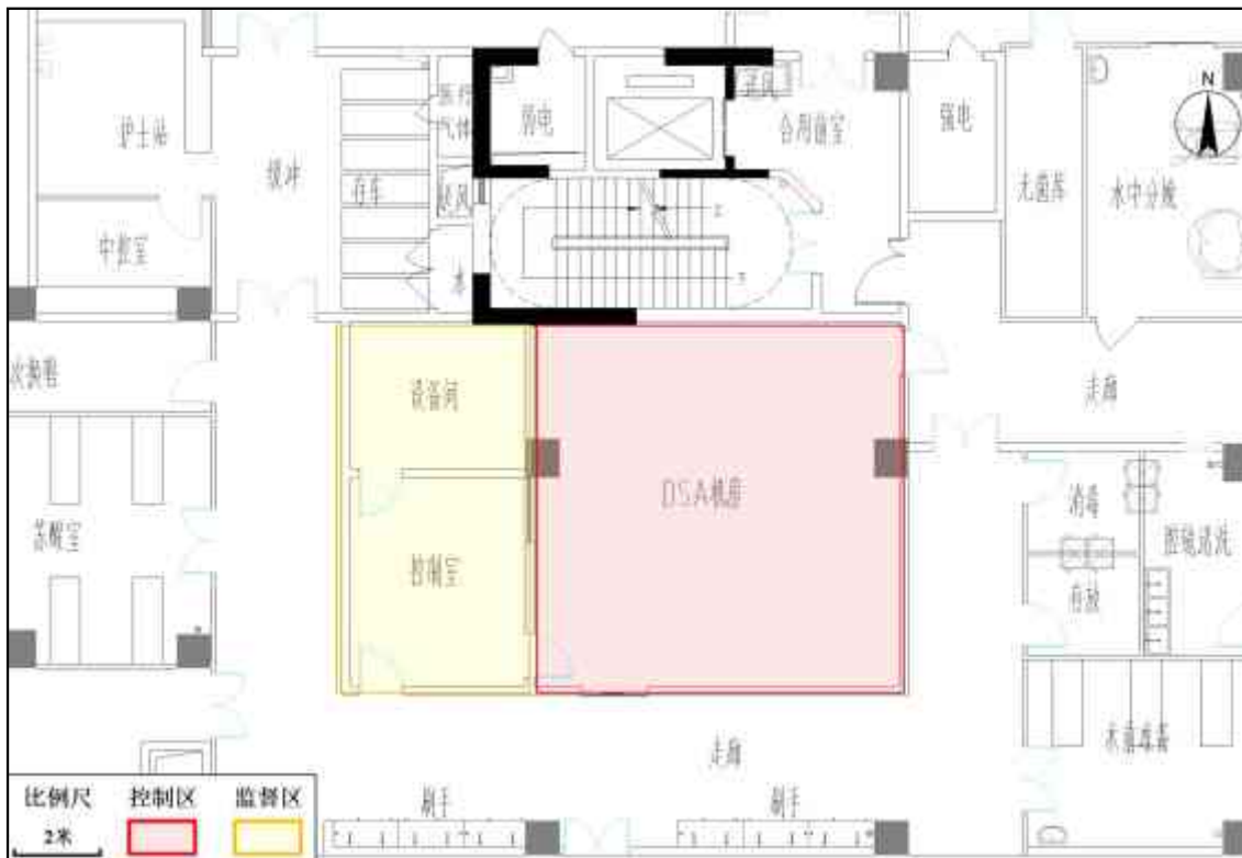
图3-2 南亭路分院病房楼四层DSA室平面布置及分区示意图

辐射防护分区： 本项目将 DSA 室作为辐射防护控制区，与机房相邻的控制室、设备间划为监督区，辐射防护分区的划分符合《电离辐射防护与辐射源安全基本标准》（GB 18871-2002）中关于辐射工作场所的分区规定。本项目 DSA 室平面布置及分区示意图见图 3-2。