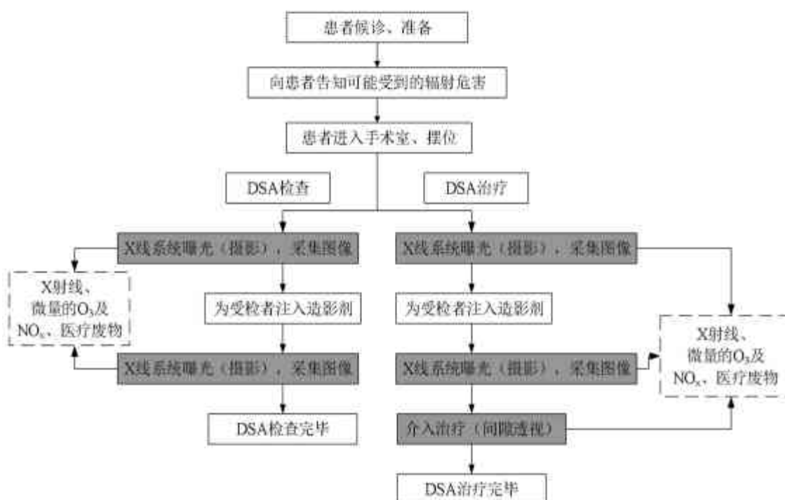
图 2-2 本项目 DSA 工作流程及产污环节示意图