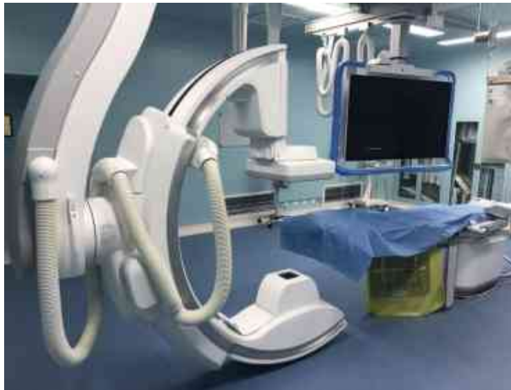
图 2-1 本项目 DSA 设备外观图

兴化市中医院配备的 1 台 Azurion7 M20 型 DSA，其最大管电压为 125kV，最大输出电流为 1000mA。该型号 DSA 设备外观见图 2-1。